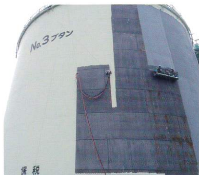
タンク塗装除去工事