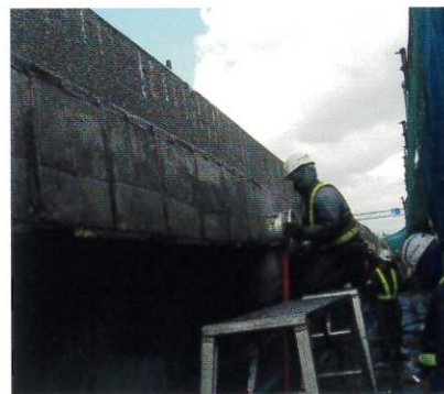
コンクリート片はく落防止対策工事 (壁高欄施工)