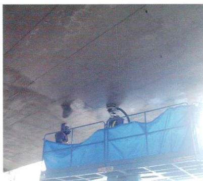
コンクリート片はく落防止対策工事 (床版下面施工)